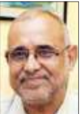
अविनाश राय खन्ना

सवेरा न्यूज/सोनिना होशियारपुर, 4 जुलाई : भाजपा के पूर्व राज्यसभा सांसद अविनाश राय खन्ना ने कहा कि पाकिस्तान में अल्पसंख्यक राजनीतिक, सरकारी और सामाजिक मार झेल रहे हैं। उन्होंने कहा कि हाल ही में पाकिस्तान के फैसलाबाद में 76 साल पुराने गुरुद्वारे के पुनर्निर्माण पर